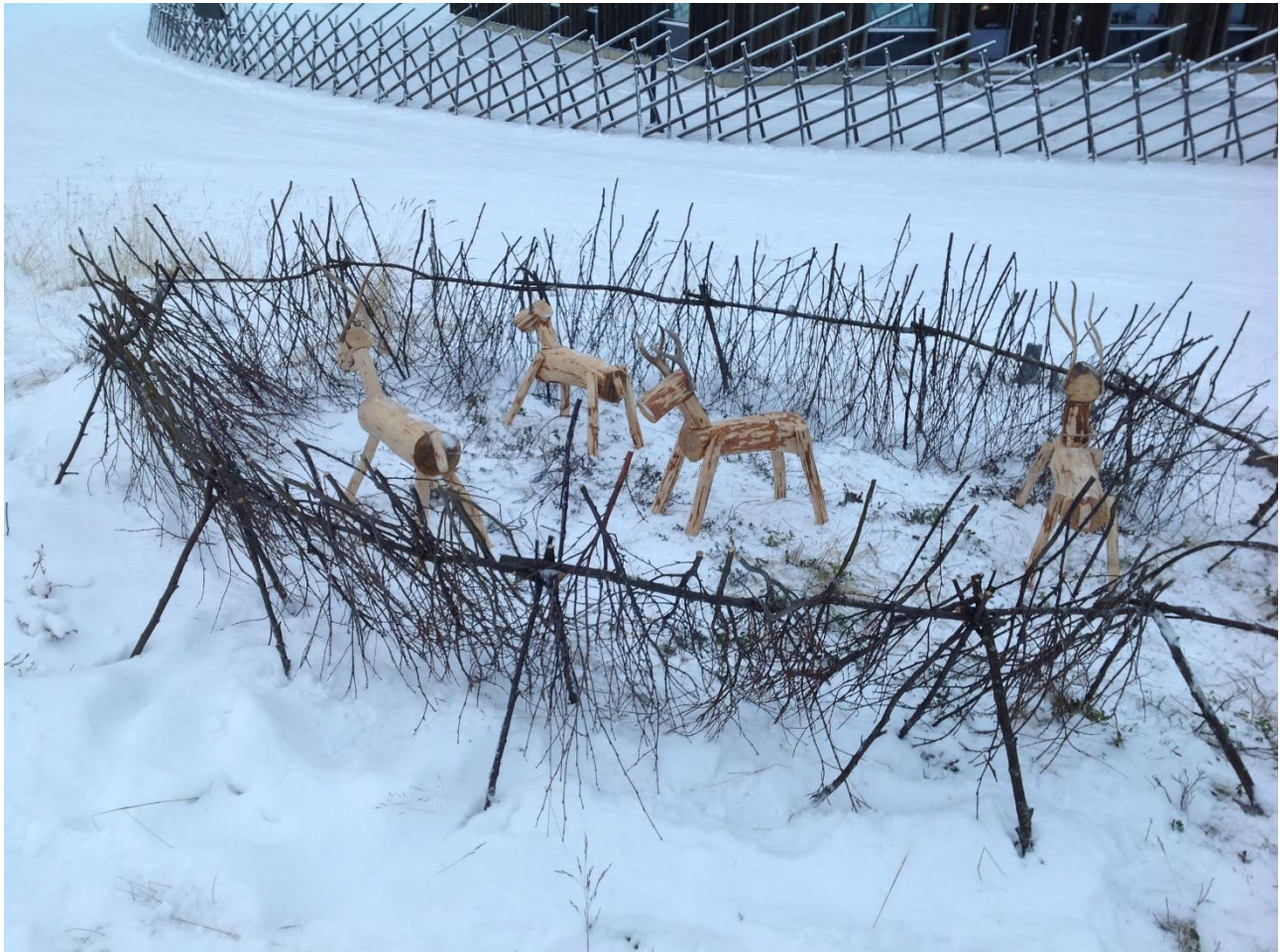
Kuva 1: Petra Biret Magga-Vars

vahva saamelainen identiteetti saamen kielten elinvoimaisuus saamelainen kulttuuri ja kulttuuriperintö perinteisten elinkeinojen elinvoimaisuus saamelainen luontoyhteys